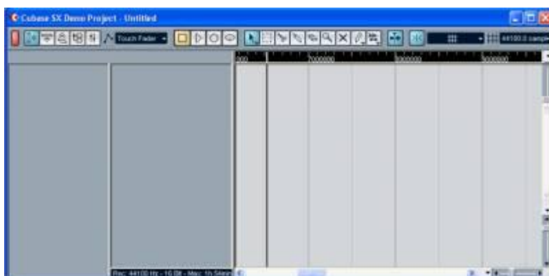
Рис. 4.1. Окно Cubase SX Project (не создано ни одного трека)

Как видно из рис. 4.1, вся остальная область окна проекта разбита на три части. Проект, представленный на рис. 4.1, пока не содержит ни одного трека. Но в будущем, после того как вы создадите хотя бы один трек (рис.